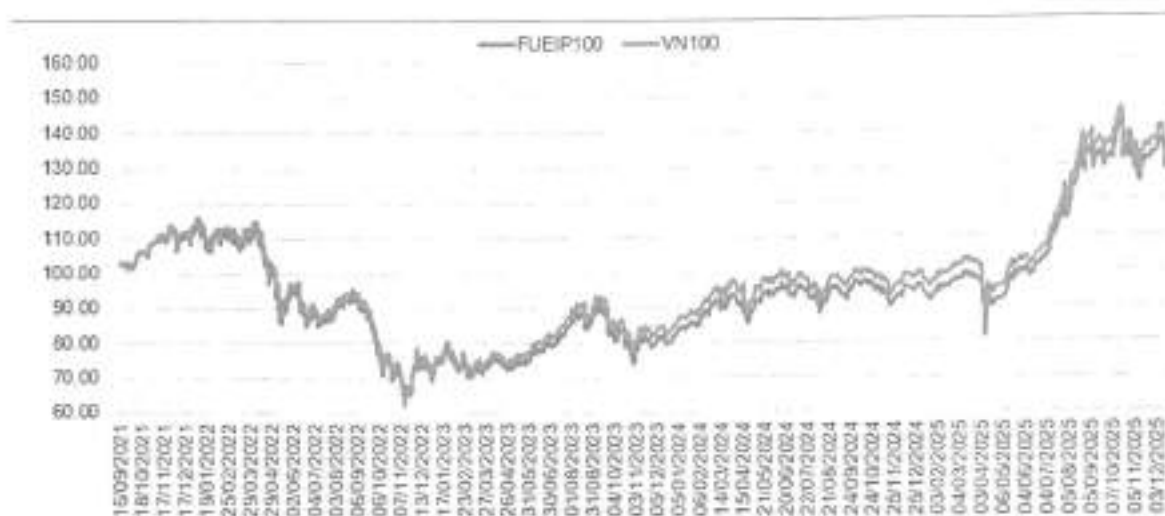
Biểu đồ tăng trưởng của FUEIP100 và bám sát chỉ số VN100